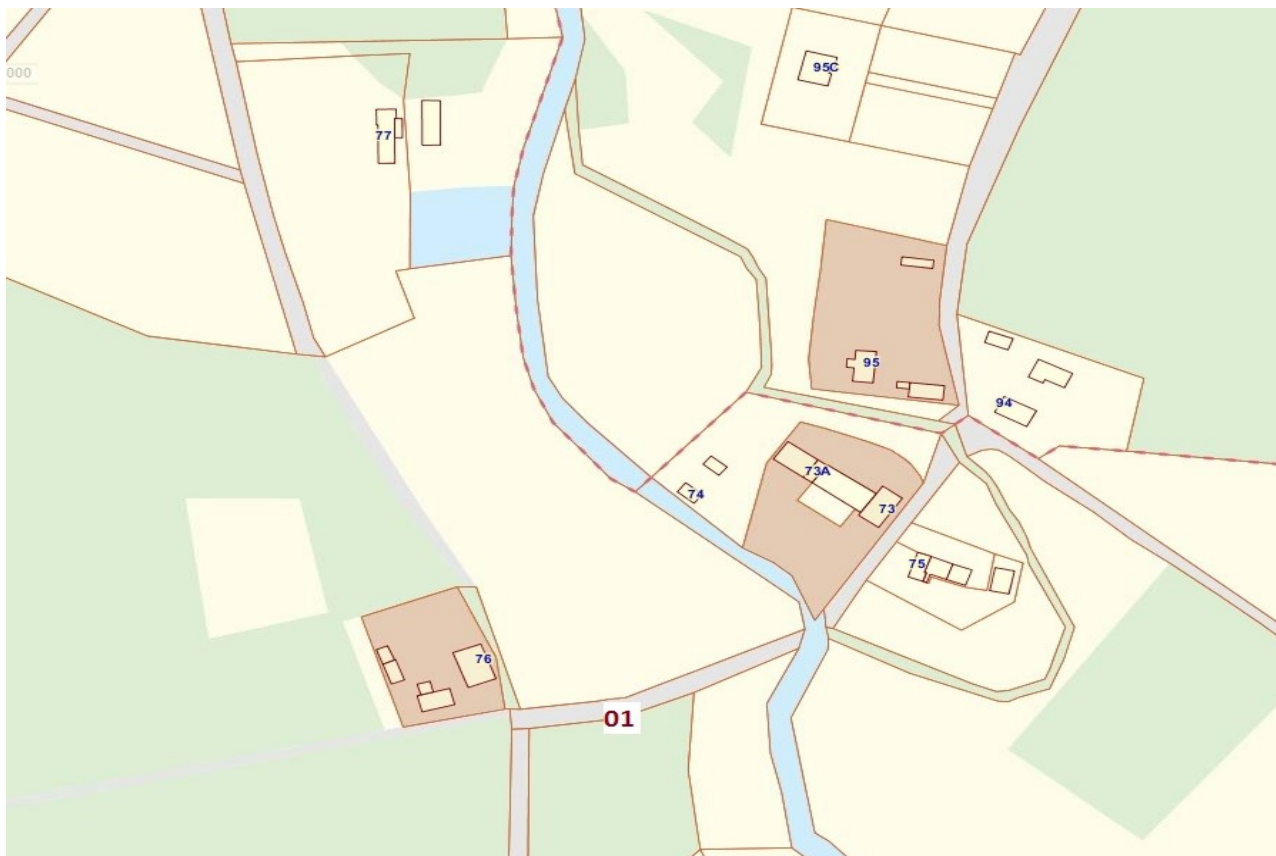
Lokalizacja przystanku w miejscowości Ołobok