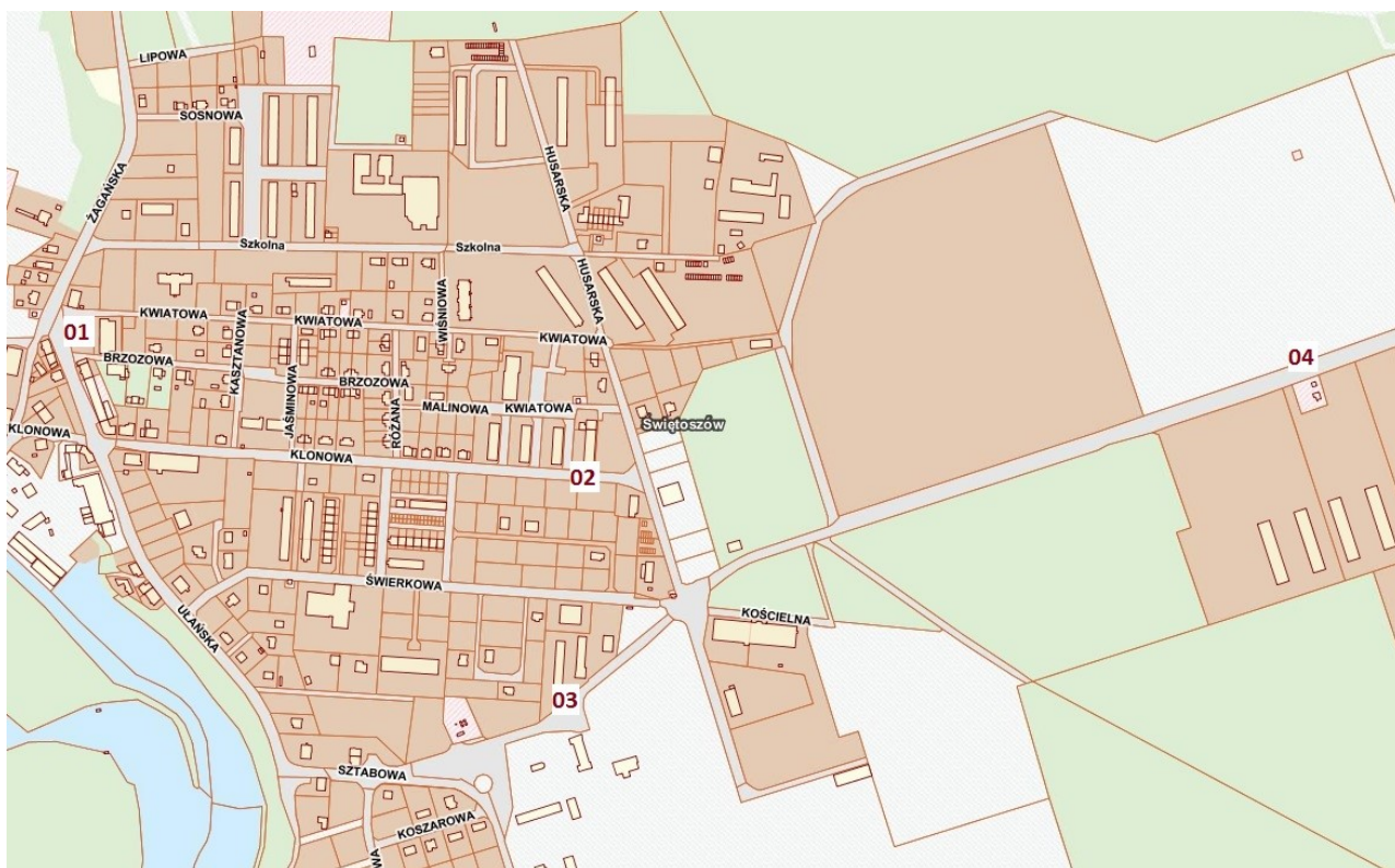
Lokalizacja przystanków w miejscowości Świętoszów